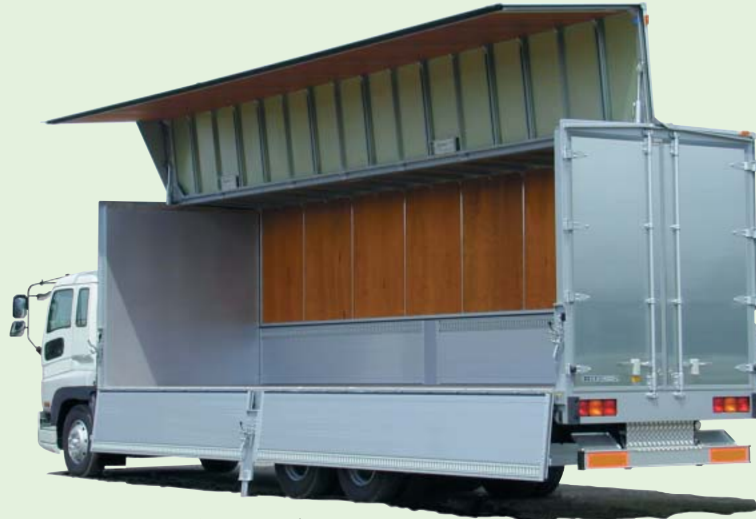
ラッシングレール等、一部オプションを含んでいます。

回転式 中間柱 オプション仕様。使い勝手が良く、スムーズな動きが特長。広幅にも対応。