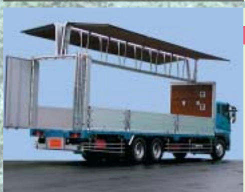
チップフラップ チップ上方投入を可能にした車輛。