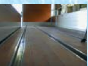
ジョロダーレール 床埋込み用荷役省力機器 床レールは2列または4列 アルミ製レールも選択可 能。