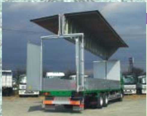
リヤリフト 後方荷役作業のため、 リヤアーチ上部をリフトアップ。