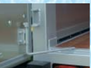
ドアホルダー リヤドアを90°固定する ためのスライド式ホルダ ー。解除も出来ます。