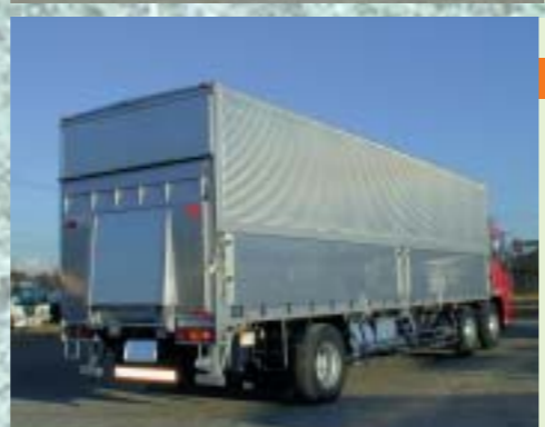
ゲートキッドアップフラップ オール油圧駆動の省力化・多目的車輛。