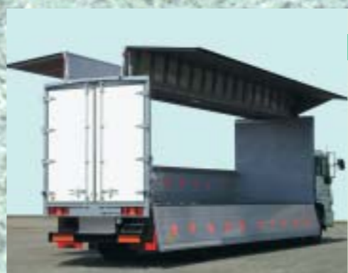
低ルーフ ルーフ開放高を低く抑えた車輛。