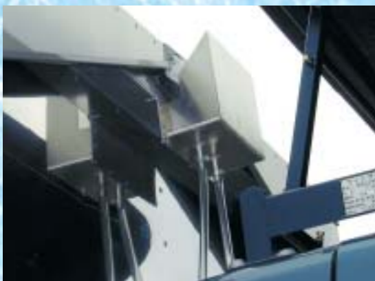
雨受け ルーフ開時の集水を、効率よく排水します。 素材は要望に応じます。 (写真はステンレス製)