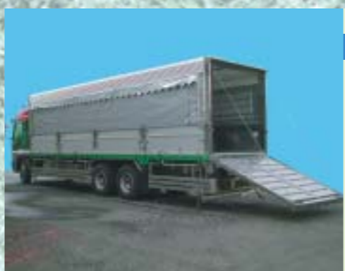
家畜運搬車 家畜運搬用のリヤスロープを取付。