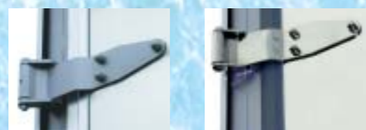
リヤドアヒンジ 左:スチール製ドア枠アルミ 右:ステンレス製ドア枠Hゴム