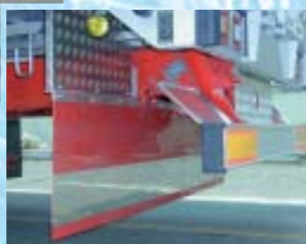
オプション架装例 写真左 ステンレス仕様:リヤドア外板、ハンドルキャチ、ドアヒンジ、ハンマーロック その他の仕様:ステップ式バンパー、リヤ看板、ルーフ操作スイッチ、テールランプ 写真中 ホーム当りゴム中央延長型:ナンバー中央取付(カバー&ライセンススランプ×2) リヤドア外板白色カラーアルミ、左右足掛けステップ 写真右 一体式泥除け。他に三分割式もあります。