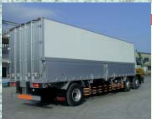
ホワイトフラップ 清潔感あふれるホワイトフラット外板。 写真は三分割。