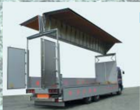
全リフト 荷役効率向上のため、 ルーフ全体をリフトアップ。