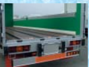
リフトローラー 油圧でローラーを上昇さ せます。写真はアルミ製。 スイッチのみの簡単操作。