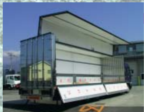
保冷車 断熱仕様車。冷凍機搭載も可能。